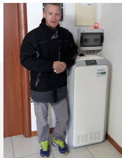
Famiglia Savioni, Agnosine (BS)

„Voglio che mio figlio cresca in un mondo più pulito e sano. Per questo ho scelto l'energia solare. Con i sistemi di accumulo SENEK posso sfruttare al massimo l'energia verde che produco e dare il mio contributo all'ambiente.“